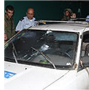
אצלנו נרצחים בהווה. בית חגי, אמש

” אם הנשיא מעוניין לדחוף לגרוננו הסכם שאינו מתאים למציאות, עטוף בגלולת הרגעה 'מימוש' עוד עשר שנים, יתכבד וידחה את ביקורו לטוד תשט