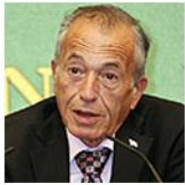
גדעון עזרא "תזכורת למצבה של ישראל"