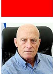
עמי איילון. "משחזרים את כל הטעויות"