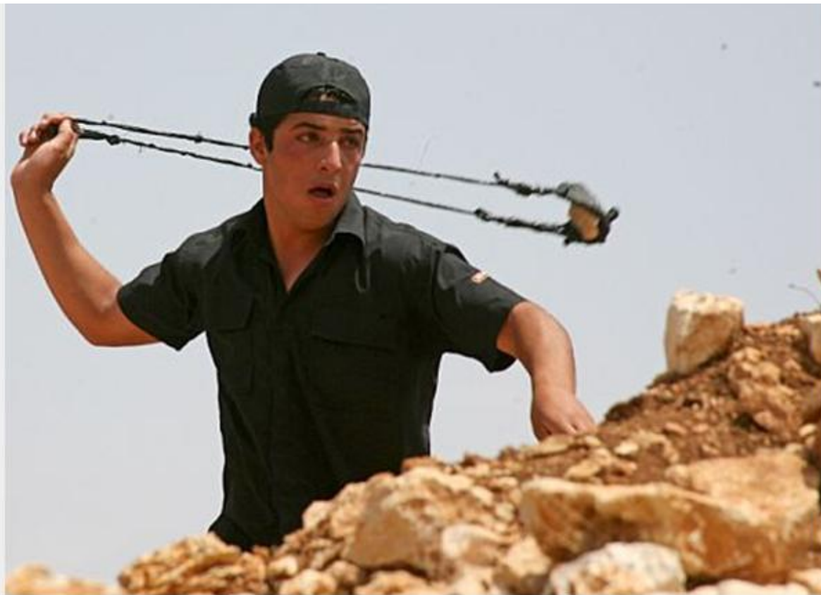
אין ברירה אלא להתקיף את המוזנים מילדות כי מי שישחט יהודים יזכה באורגיות מלהיבות עם עשרות בתולות